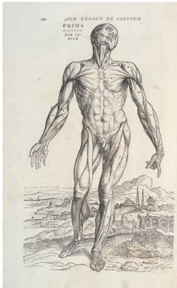
planche d'illustration, 1555, ouvrage, Montpellier, Université de Montpellier, Bibliothèque universitaire historique de médecine, Eb 87 in-fol